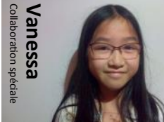
Vanessa Collaboration spéciale