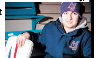
De nos lecteurs

Il joue pour National de Montréal (pee-wee AAA). Ses statistiques ont de quoi réjouir son équipe et inquiéter ses adversaires.